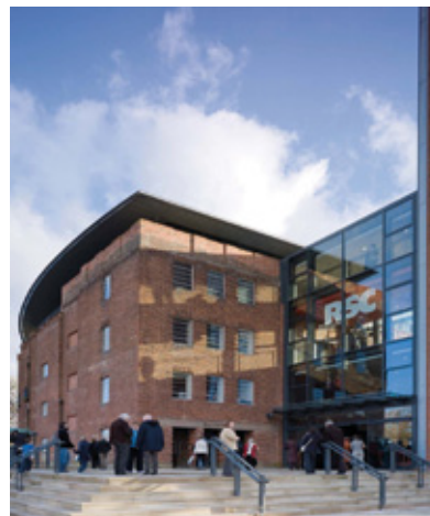
Royal Shakespeare Theatre UK