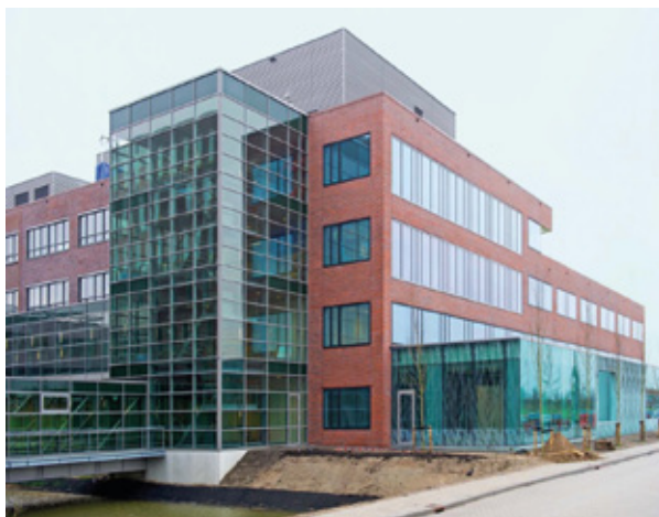
Antoni van Leeuwenhoek Hospital Hoofddorp (Netherlands)

Intervine offers help from its Technical Sales managers and support from the Group Technical team.